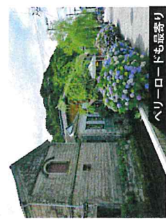
ヘリロードも最寄り