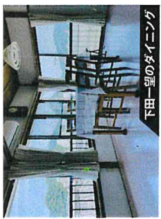
下田一望のダイニング