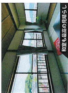
和室も最高の見晴らし