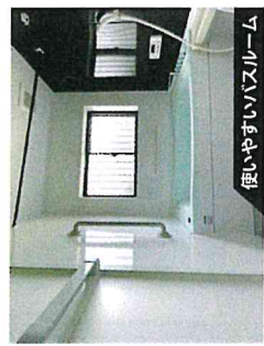
使いやすいバスルーム