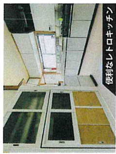
便利なレトロキッチン