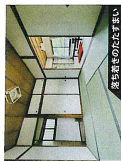
落ち着きのたぐずまい